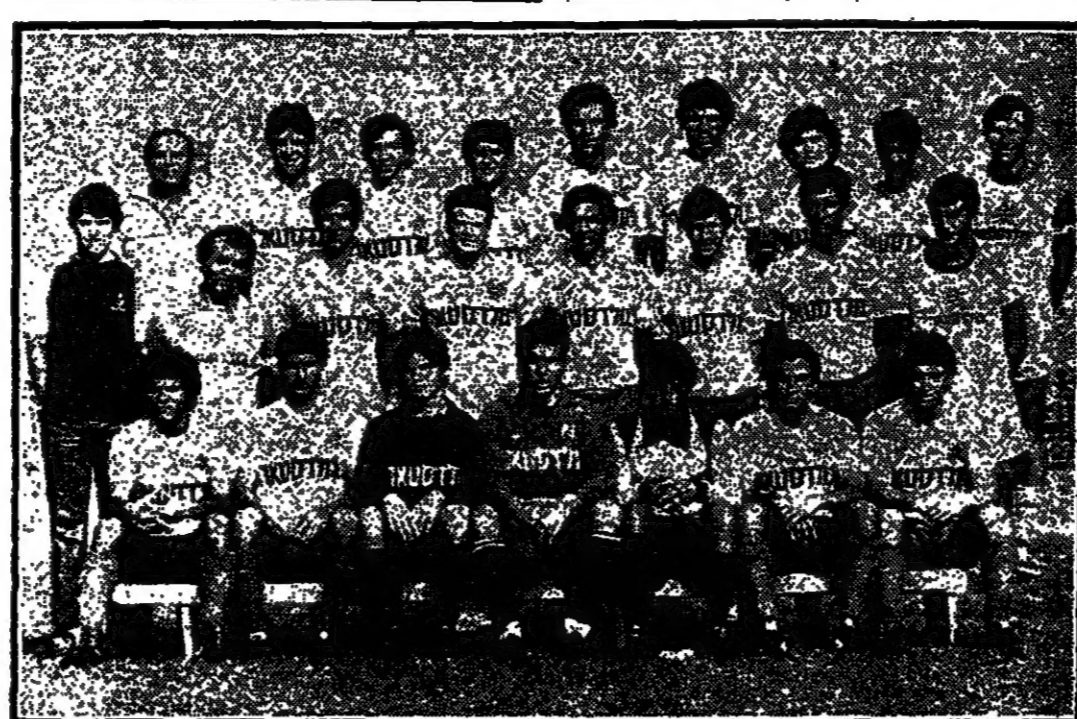
فريق مكابي تل ابيب لم يتمكن من الفوز على شمشون تل ابيب بل انهى المباراة بالتعادل السلبي .